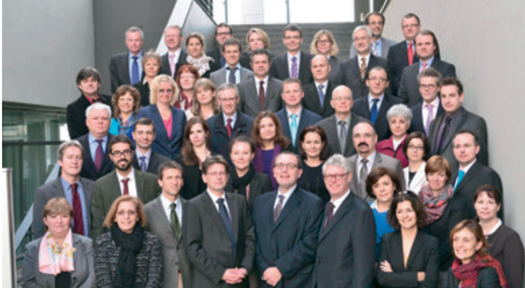
Tionde mötet med Easos styrelse i Malta den 4–5 februari 2013.