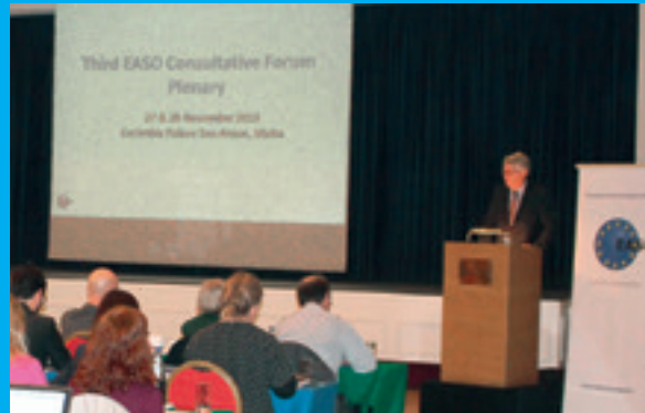
Tredje rådgivande forumet i Malta den 27–28 november 2013.

Easos rådgivande forum är en löpande dialog som möjliggör utbyte av information och sammanslagning av kunskap mellan Easo och det civila samhället.