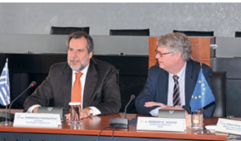
Den operativa planen för Grekland undertecknades i Aten den 1 april 2011.

Efter en begäran från den grekiska regeringen i februari 2011 beslutade Easo att hjälpa Grekland med att inrätta en ny asyltjänst, en enhet för första mottagning och en överklagandemyndighet och med mottagningen i allmänhet samt att minska eftersläpningen genom att placera ut experter från EU:s olika medlemsstater i form av de så kallade asylstödgrupperna. Under den första fasen av stödet till Grekland, som avslutades i mars 2013, placerade Easo ut och administrerade 70 experter från 14 medlemsstater. De bildade totalt 52 asylstödgrupper. Efter det att den grekiska regeringen i början av 2013 begärde ytterligare stöd fortsatte Easo att stödja Grekland fram till december 2014. Under denna andra fas bestod Easos stöd av utplacerade asylstödgrupper som gav utbildning i nationalitetsbestämning (i nära samarbete med Frontex) och stöd avseende EU-finansiering, stöd avseende insamling och analys av statistiska uppgifter och stöd när det gäller information om ursprungsländer. Efter en eventuell begäran från den grekiska regeringen kan Easo omorganisera eller utöka sin verksamhet.