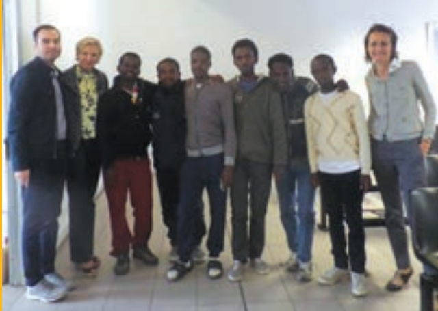
EASO 员工以及从意大利重新安置的第一组人员。

重新安置是将明确需要国际保护且提出过庇护申请的人士从一个欧盟成员国转移到另一个欧洲国家的行为。相关人士的庇护申请将仅在重新安置后再行审核。当前，重新安置的来源国包括意大利和希腊。