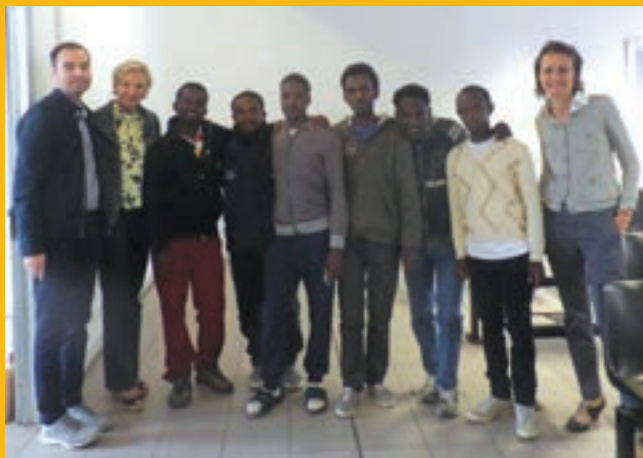
Personeli i EASO me anëtarët e grupit të parë të njerëzve që janë rivendosur nga Italia.

Rivendosja është transferimi i azilkërkuesve që kanë nevojë të qartë për mbrojtje ndërkombëtare nga një shtet anëtar i BE-së në një shtet tjetër evropian. Kërkesa e azilit do të ekzaminohet vetëm pas rivendosjes së azilkërkuesit. Rivendosja është e mundur vetëm nga Italia dhe Greqia.